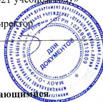
График посещения столовой обучающимися в 2020-2021 учебном году Корпус 1 (ул. Баумана,5)